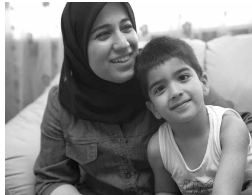
Nogle gange tænker jeg, at danskere og indvandrere er bange for at snakke med hinanden. Men kvinder er kvinder. De har de samme følelser.

»De fleste af mine kolleger er mænd. Jeg er glad for dem. Jeg tænker ikke